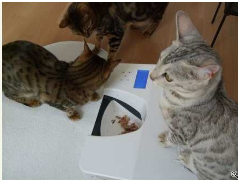
Der CATSOMAT in Aktion!

Köln. Geschäftsreisen, Urlaub oder ein Wochenendausflug? Dabei aber stellt sich die Frage: wohin mit dem geliebten Stubentiger, wenn man nicht zu Hause ist? Um diesem Umstand begegnen zu können, bedarf es intelligenter und bedarfsgerechter "Assistenten", die auch bei Abwesenheit die artgerechte, sichere und zuverlässige Versorgung der Vierbeiner übernehmen.